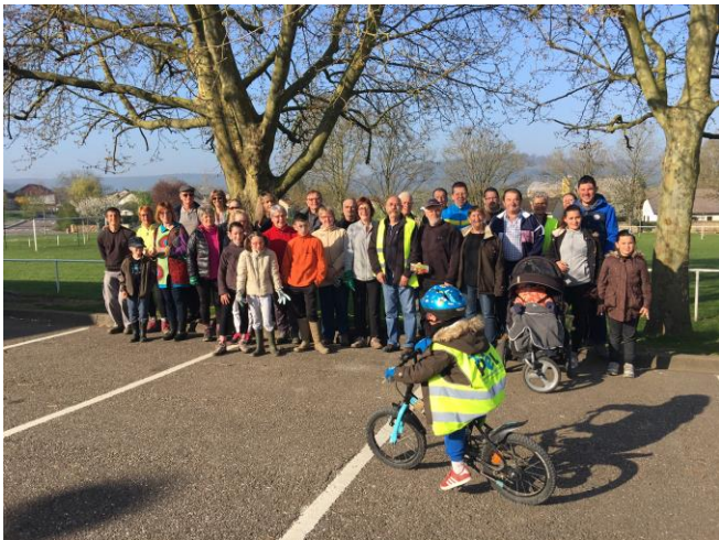
L'équipe du nettoyage de printemps en 2017

Le programme distribué dans vos boîtes aux lettres vous informe de toutes les manifestations prévues sur le territoire et particulièrement dans notre village. A noter la séance de taille sur le verger pédagogique le jeudi 22 mars, le parcours animé sur la véloroute aux étangs d'Autreville le samedi 24 mars et le rallye photos.