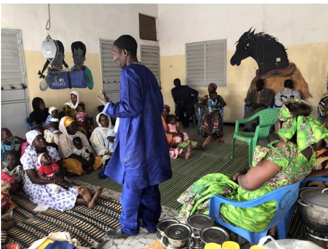
Conférence puis cours de cuisine dans l'école maternelle VERSO

Une convention a été signée entre le maire du village, le président de l'association ASBEF (Association Sénégalaise pour le Bien-Etre des Familles) et VERSO. Cette convention prévoit le financement et le suivi par VERSO et la commune du dépistage de la malnutrition de 500 enfants de 0 à 6 ans du village de Ndiarème. Elle prévoit également la prise en charge des enfants malnutris (compléments alimentaires) et des conférences de quartier avec cours de cuisine pour les mamans.