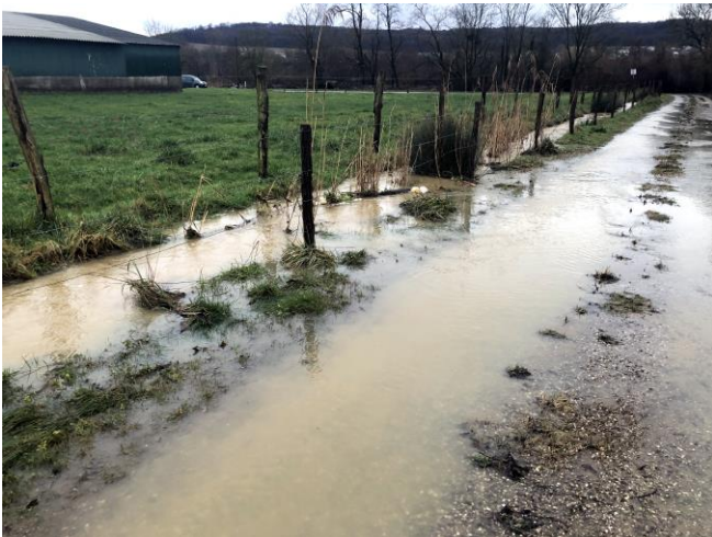
Le ruisseau du Rouot déborde le fossé de la STEP

Cela n'a échappé à personne, la météo joue avec nos nerfs depuis trop longtemps.