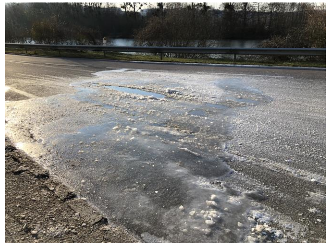
Glace dangereuse sur la départementale

Ce froid glacial nous a causé un problème de gel de la conduite d'eau potable (au niveau du 23 Grande Rue et a dû être réparée en urgence. De la glace s'étant formée sur la route et le trottoir, il a fallu la casser, saler, et surveiller en attendant que tout soit remis en état. D'autres rues du village (rue du Sorbier, rue du Planté) ont également été concernées par des écoulements d'eau qui gelait aussitôt.