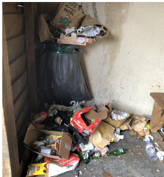
Que dire de plus ? Trop, c'est trop !!!

Même par temps frais, l'abribus de la place du Lavoir reçoit ses occupants habituels... A peine nettoyé, il reprend en quelques jours son allure de dépotoir. Quelle belle image pour les enfants de l'école et de l'accueil périscolaire ! Pour mettre fin à cet état de fait, dans l'impossibilité de raisonner les utilisateurs, nous allons le démonter dès que possible. Cet abri aura son utilité ailleurs, et pourquoi pas sur le verger pédagogique ?