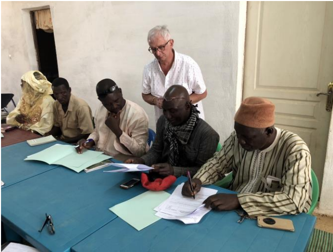
Signature de la convention maire – ASBEF et VERSO