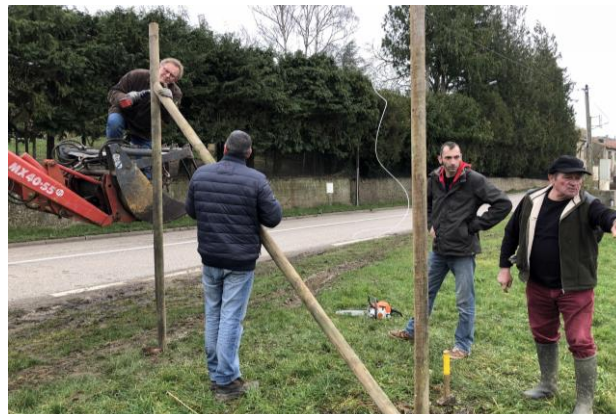
Pose des poteaux à houblons à l'entrée du village