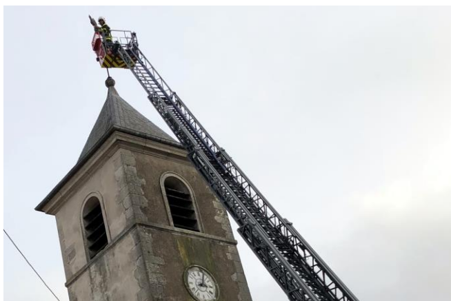
Il a fallu la grande échelle des pompiers pour descendre le coq

Le coq du clocher de l'église, pourtant habitué au vent qui est sa raison d'être, n'a pas supporté les tempêtes de la fin d'année 2017. Il était prêt à s'envoler et il a fallu l'intervention des pompiers avec leur grande échelle pour le descendre. Notre coq a été présenté aux habitants lors de la cérémonie des vœux et largement caressé, ce qui, paraît-il, porte bonheur. Actuellement en réparation grâce à des ferblantiers bénévoles, il sera remis sur son perchoir après sa rénovation.