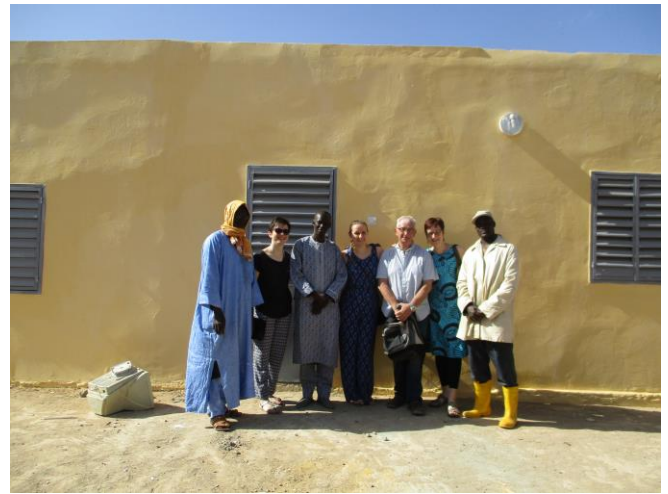
Devant l'Espace Adolescents rénové

informatique d'un Espace Adolescents dans le poste de santé de Gaé. Ce local est destiné à recevoir des adolescent(e)s et jeunes adultes en consultation et recherche d'informations et de conseils sur la « santé de la reproduction » : prévention des grossesses précoces, contraception, MST, ... Cet Espace Adolescents est aujourd'hui fonctionnel.