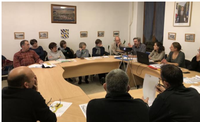
17 personnes ont participé à cette réunion

département ont assisté à la présentation par le bureau d'étude. En seconde partie de réunion, chacun a pu s'exprimer quant aux possibles moyens de préserver ces espaces naturels mais également de les valoriser. La dernière partie de l'étude consistera justement à proposer des outils de valorisation de ce site tellement apprécié des promeneurs et cyclistes. Compte rendu de l'étude sur le site de la commune.