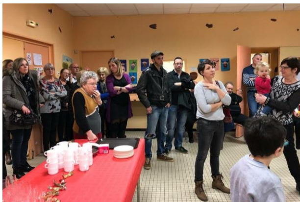
Peu de monde cette année à la cérémonie des vœux