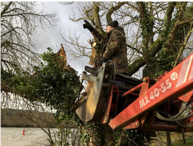
Merci aux bûcherons bénévoles...

Des quantités astronomiques d'eau tombées ces derniers mois occasionnent des crues un peu partout dans le Grand Est et n'ont pas épargnées AUTREVILLE. Le jour des vœux du Maire (weekend du 6 janvier), la départementale a dû être coupée. La dernière tempête a provoqué de nombreuses chutes d'arbres ou de branches.