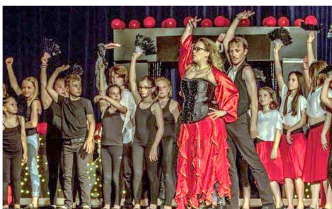
Gala de danse 2017 à Pont-à-Mousson