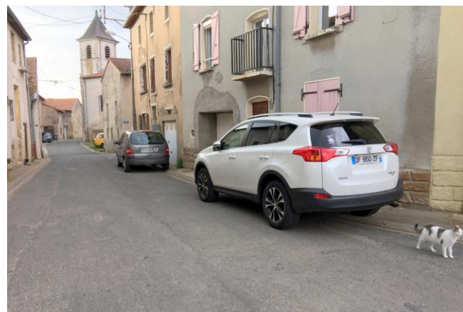
Les véhicules sur la photo ne sont pas particulièrement mis en cause

Ainsi que nous l'avons annoncé dans un précédent bulletin, le stationnement va être réglementé dans certaines parties de la Grande Rue et de la rue de la Côte. Alors que les parkings restent peu occupés, il est aisé de constater que les propriétaires veulent à tout prix stationner leur véhicule devant leur porte. C'est ainsi que l'on trouve le soir ou pendant le week-end des voitures arrêtées dans les virages ou dans des parties de chaussée étroites, empêchant le croisement des usagers et particulièrement des camions ou engins agricoles. Nous savons qu'il est compliqué de trouver de la place alors que chaque foyer dispose parfois de deux ou trois véhicules, mais nous devons veiller à la sécurité de tous et à la libre