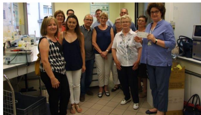
Marche contre le cancer : remise du chèque de 1 560 € à l'ICL