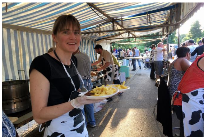
Les bénévoles s'activent au feu de la Saint-Jean