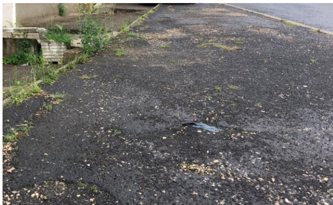
Un exemple parmi d'autres : rue de la Forêt

L'entreprise « Boudrique Paysages » entretient les nombreux espaces verts de la commune. Le montant de cet entretien est de 15 000 € par an, ce qui correspond à 22 heures par semaine environ. Les ressources de la commune ne permettent pas davantage. Ce temps est largement insuffisant pour permettre d'effectuer en plus le désherbage des trottoirs, d'autant que désormais les collectivités n'ont plus le droit d'utiliser de produits phytosanitaires. Nous vous rappelons que l'entretien des trottoirs (désherbage, déneigement, ...) est de la responsabilité des riverains. Nous vous remercions vivement de bien vouloir effectuer ce désherbage devant votre domicile. Notre environnement n'en sera que plus agréable. Merci pour votre compréhension et pour votre aide !