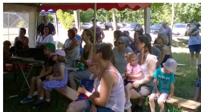
Balade contée Croqu'livres sur l'ancienne base de voile d'Autreville