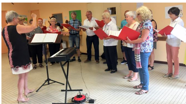
La chorale Mill'Autr'Chants fête la musique à Autreville